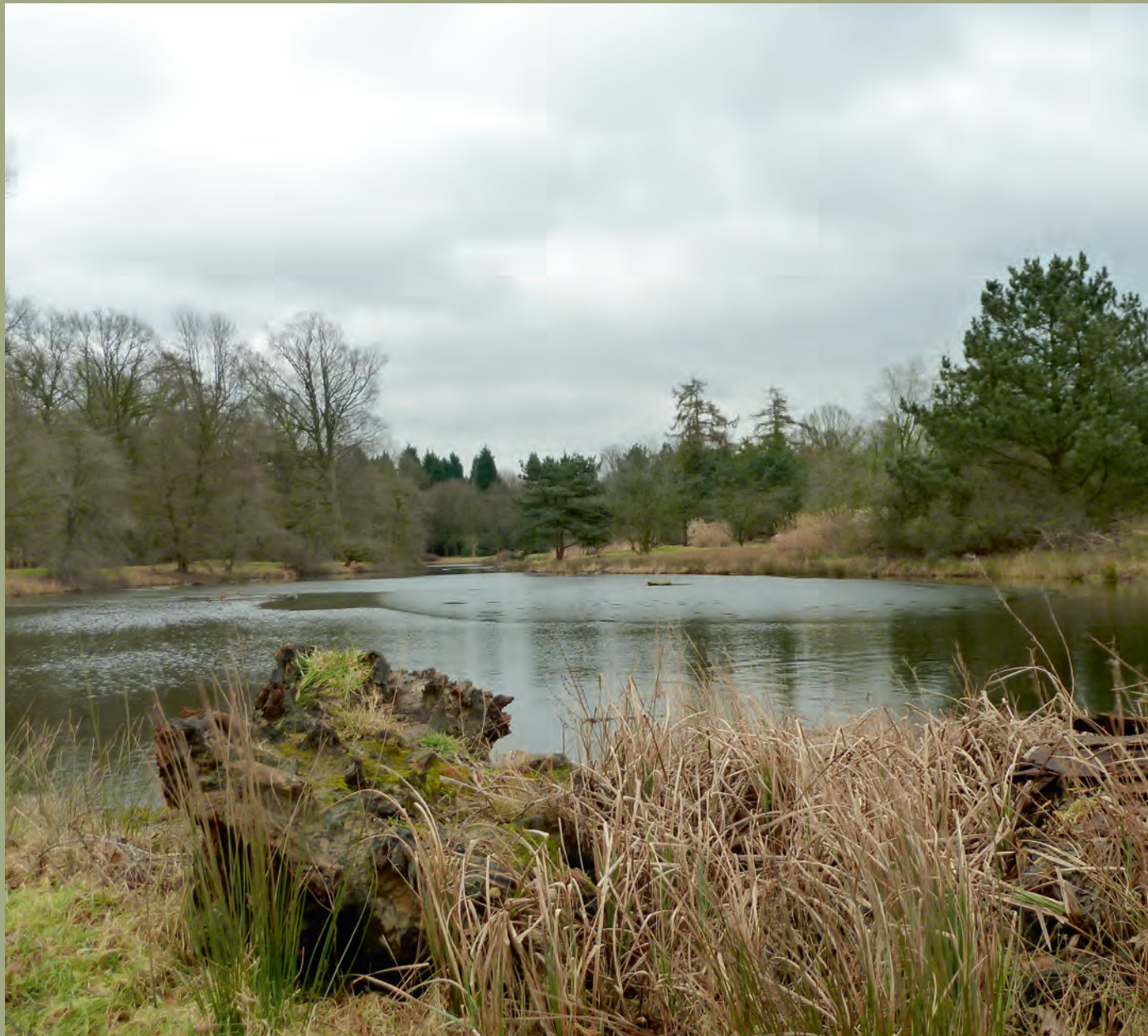
Landgoed Hemelrijk, Essen (België). Gezicht op de vijver, 2012. Fotografie M. van Lidth de Jeude.