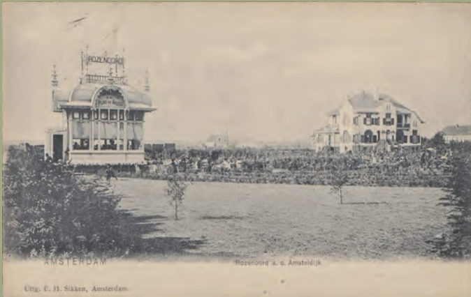
Rozenoord aan de Amsteldijk, Amsterdam, 1905. Ansichtkaart uitgeverij E.H. Sikken, Amsterdam; Beeldbank Stadsarchief Amsterdam.