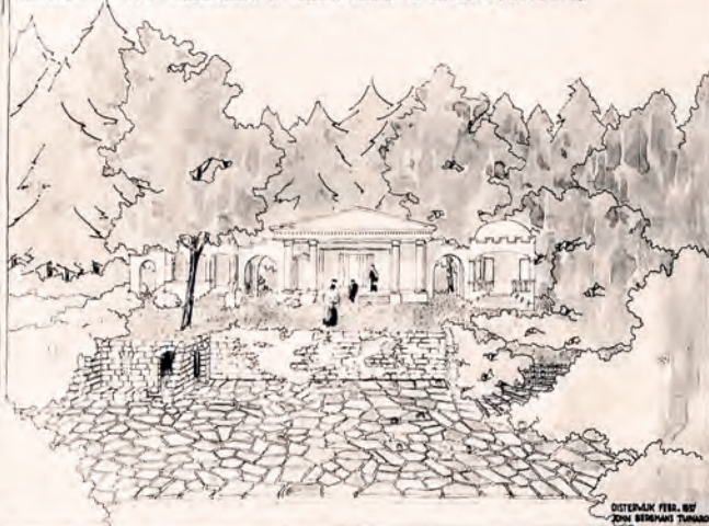
OPENLUCHT-THEATER "PASSIESPELEN" TE TEGELEN PERSPECTIEF AANLEG EN BEPLANTING

WIJ GEVEN GRATIS ALLE INLICHTINGEN, zonder eenige verplichting, aan onze cliënten in verband met moeilijkheden die zij met hun tuin of planten mochten ontmoeten. Ook zij die cliënt willen worden kunnen hiervan gebruik maken.