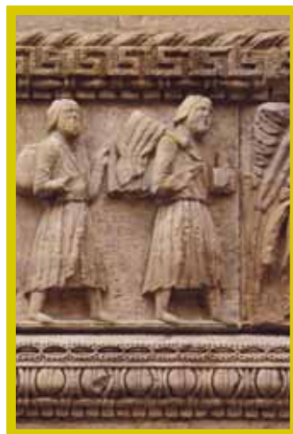
Pelgrims op weg naar Rome. Fries uit de dom van Fidenza.