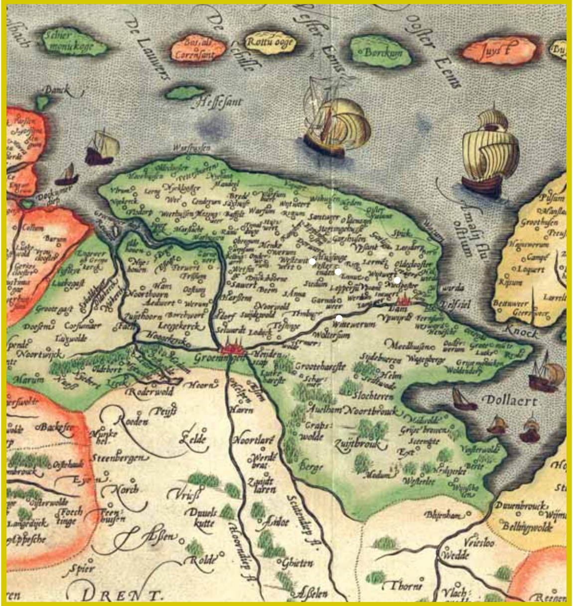
Detail van de kaart van Friesland uit 1568, door de cartograaf Abraham Ortelius, met het opschrift: Oost ende West Vrieslands beschryvinghe. Utriusque Frisiorum regionis novissima descriptio (de nieuwste beschrijving van beide regio's der

Friezen). De kaart werd vaak herdrukt en in 1584 opgenomen in de atlas met de titel Theatrum Orbis Terrarum. Op deze kaart zijn de belangrijkste plaatsen uit Emo's leven aangegeven met een witte stip.