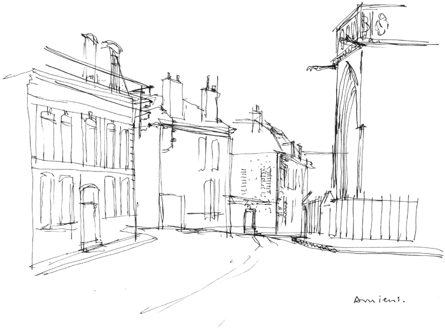
Reisschets Amiens, Frankrijk, 1950.