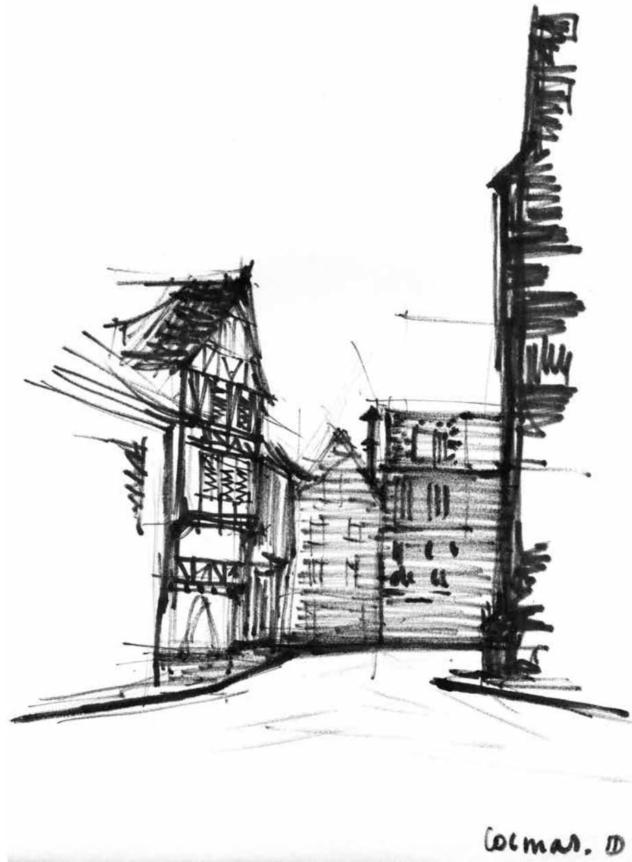
Reisschets Colmar, Frankrijk, omstreeks 1950.