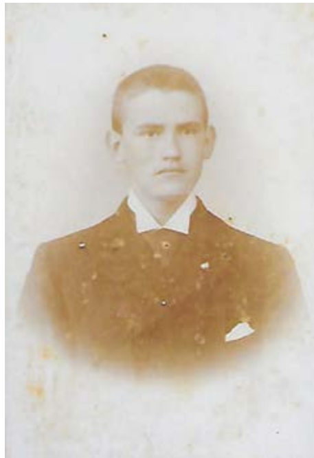
geveer achttien jaar oud.