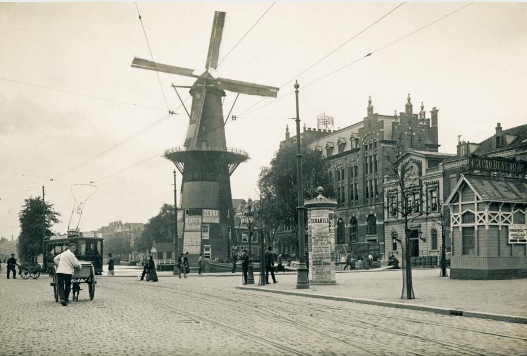
Stadsbeeld Rotterdam: de Coolvest aan het begin van de twintigste eeuw met molen de Hoop en rechts de witte classicistische gevel van de Academie voor Beeldende Kunsten en Technische Wetenschappen.