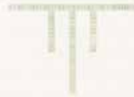
Voorzijde van een brochure uit 1924.