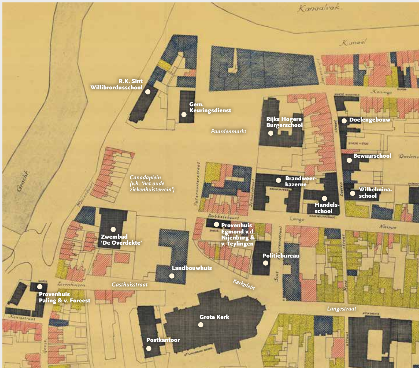
Detail van een plattegrond van de binnenstad van februari 1945, met daarop aangegeven de belangrijkste openbare gebouwen in dit deel van de stad.