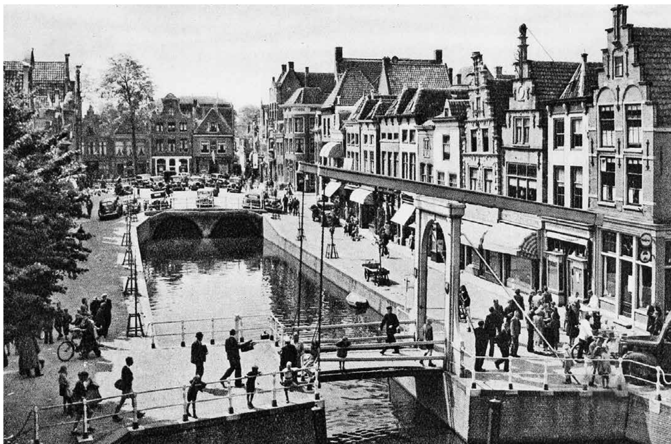
De Bathbrug en de Mient, met op de achtergrond de Gewelfde Stenenbrug, medio jaren veertig.

De binnenstad was het middelpunt van deze kleine stad, nog geen anderhalve kilometer van west naar oost en ruim 600 meter van noord naar zuid. In 1254 had het stadsrechten ontvangen van graaf Willem II, om daarna uit te groeien tot de marktstad voor de regio. 1573 was het jaar van het bekendste en meest herinnerde moment van de geschiedenis van de stad: het beleg door de Spanjaarden en het Alkmaars Ontzet. De bolwerken, die we nu nog steeds grotendeels herkennen in de contouren