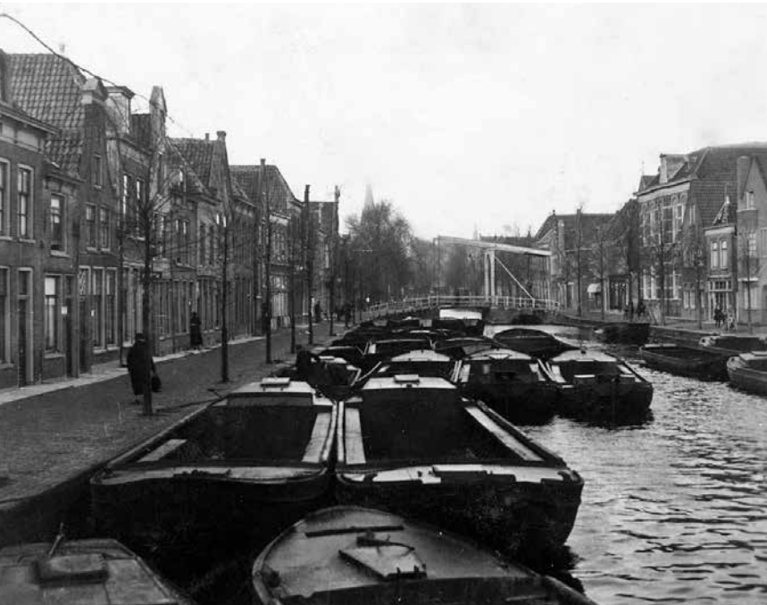
Vletten in het Verdronkenoord, rond 1950.

Als we in een tijdmachine terug zouden gaan naar de Alkmaarse binnenstad van 1945, zouden we vreemd opkijken. De straten en steegjes kennen we nog en we herkennen natuurlijk de Grote Kerk, het Waagplein en tal van andere gebouwen. Maar de verpaupering van de binnenstad zal ons zeker opvallen. De vervuilde grachten, de vervallen bebouwing in grote delen van de stad en de auto's die overal mochten komen bieden een heel andere aanblik dan het mooie historische centrum zoals we dat tegenwoordig kennen.