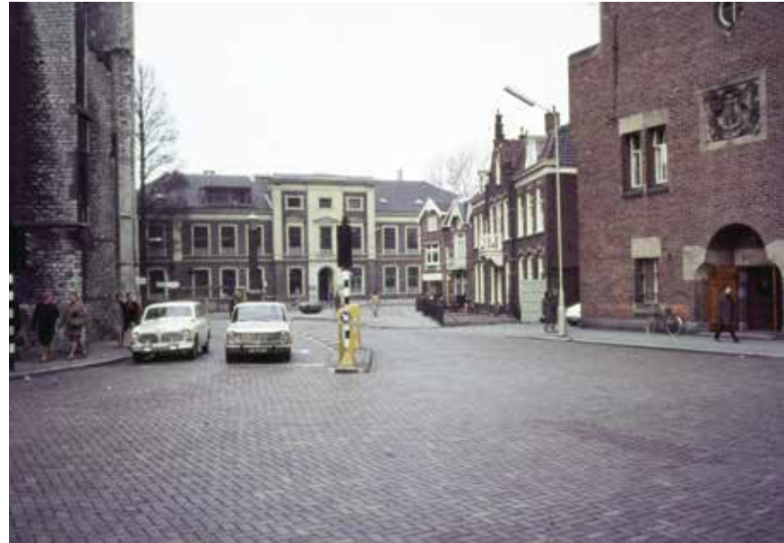
Het Kerkplein met op de achtergrond het Landbouwhuis, eind jaren zestig.

Voordat we in een volgend hoofdstuk gaan zien welke plannen daarvoor gemaakt werden, gaan we eerst terug naar de tijd van net na de oorlog. Waar sommige steden zoals Rotterdam, Den Helder, Nijmegen en Groningen hun binnenstad tijdens de oorlog tot een rokende puinhoop gebombardeerd zagen worden, kwam die van Alkmaar vrijwel ongeschonden uit de oorlogsjaren. Dat wil zeggen: niet geschonden door oorlogsgeweld. Het aangezicht van de binnenstad was wel degelijk geschonden, maar dat had een andere oorzaak. Voordat we gaan onderzoeken wat er mis mee was, gaan we eerst kijken wat er precies te zien was. Hoe lag de binnenstad er na de oorlog bij? Wat gebeurde er, hoe leefde men hier? Om hier inzicht in te krijgen, is het