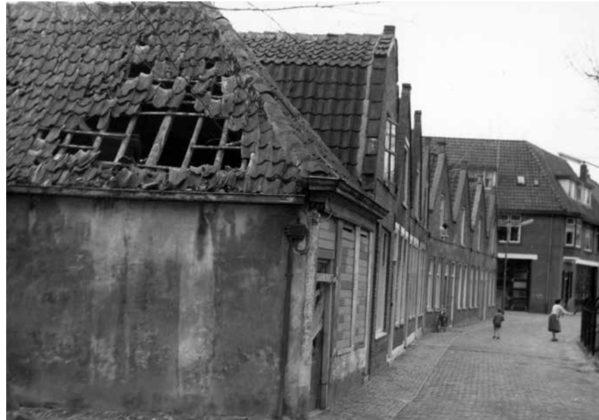
Woningen in de Molenbuurt, gezien richting het Zevenhuizen, medio jaren vijftig.

Direct ten westen van Grote Kerk staat een groot, massief gebouw. Dit is een restant van het voormalige Rijksopvoedingsgesticht, waar men in de negentiende en een klein deel van de twintigste eeuw trachtte ontspoorde jongens op het rechte pad te krijgen. In 1948 trekt een garnizoenscommando van het Nederlandse leger in het pand. Alkmaar is een jaar eerder aangewezen als garnizoensstad en drie bataljons militairen zullen hier een aantal jaren verblijven. Ze hebben onder meer als taak het bewaken van militaire objecten in het noordelijke deel van Noord-Holland. 1 In de open ruimte tussen dit gebouw en de westgevel van de Grote Kerk waait het constant, vandaar dat deze ruimte het 'Waaigat' wordt genoemd. Ten zuiden van de kerk ligt de Kerkstraat. Hier zien we een rijtje woninkjes staan die in een absoluut deplorabele toestand verkeren. Aan de Koorstraat staat het gebouw 'De Unie', waarin in 1948 het kantongerecht wordt gevestigd.