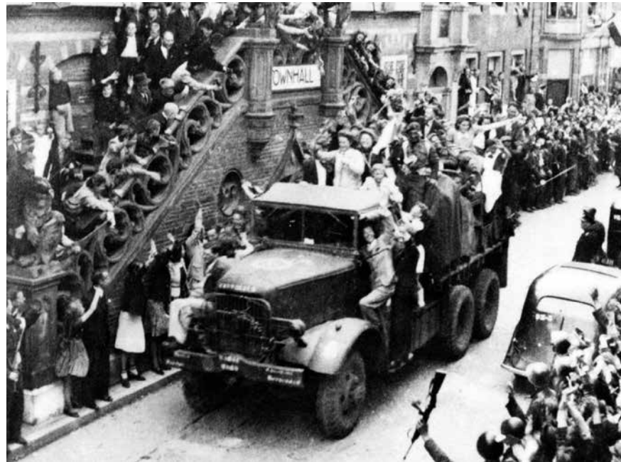
Onthaal van de Canadese bevrijders bij het stadhuis in de Langestraat, mei 1945.

Alkmaar in het jaar 1945 was qua oppervlak maar een fractie van de stad zoals we die vandaag de dag kennen. Het bestond allereerst uit de binnenstad. Dit was het gebied binnen de singelgracht, in het noorden begrensd door het Noord-Hollands Kanaal. Dat kanaal had het noordoostelijke deel, ook bekend als het Schermer-eiland, van de binnenstad afgesneden en dit gebied werd ook niet meer tot de binnenstad gerekend. Het zuidoostelijk deel heette ook wel de Schelphoek en hoorde wel bij de binnenstad. Daarbuiten was in de vijftig jaar voorafgaand aan de oorlog alleen in het westen en het zuiden bebouwing bijgekomen. Ten westen van de binnenstad lag de Spoorbuurt, kleine woninkjes voor arbeiders en de middenklasse, aangelegd aan het eind van de negentiende eeuw. Ten zuiden daarvan lag de Nassaubuurt, enkele jaren later gebouwd voor de gegoede burgerij. In het verlengde van de Bergerweg stonden woningen, in een driehoek begrensd door de Oude Hoeverweg, de Jan van Scorelkade, de Ruysdaelkade en de Nicolaas Beetskade. Ten zuiden van de binnenstad lagen het Westerhoutkwartier, het Burgemeesterskwartier, het Lyceumkwartier en het Emmakwartier, met hun statige panden voor de gegoede middenstand. Mensen met minder vermogen woonden wat bescheidener in het Landstratenkwartier, Oud-Rochdale en