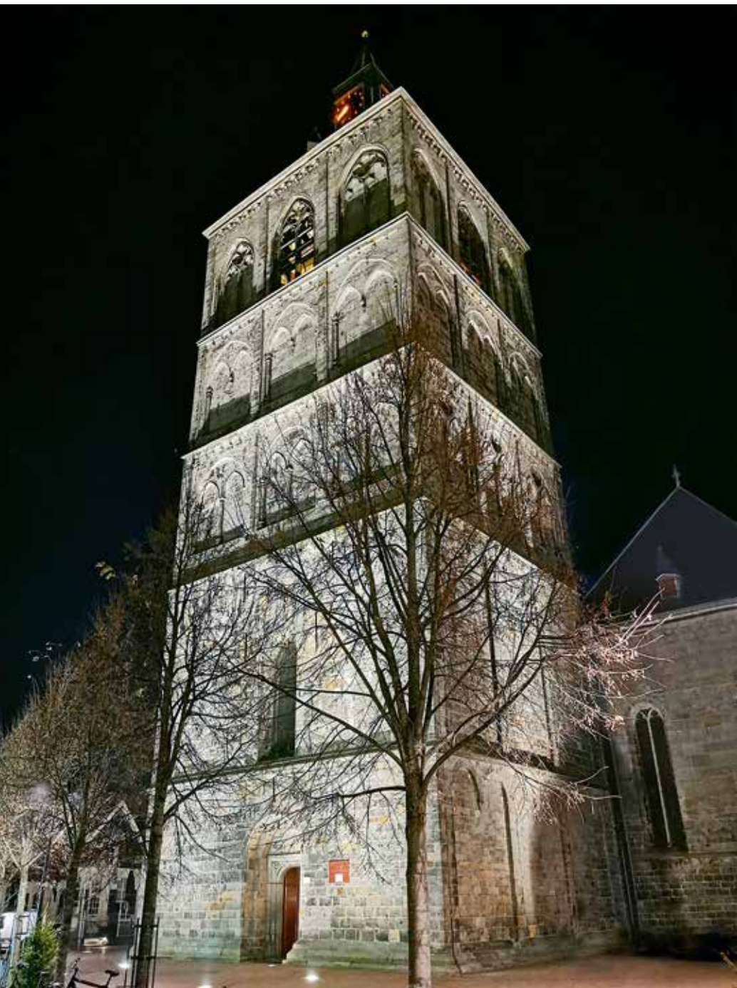
Afb. 1 | Toren van de St. Plechelmusbasiliek, dec. 2021. De eerste vier geledingen kwamen tot stand tussen ca. 1220 en 1250, de vijfde rond 1500.