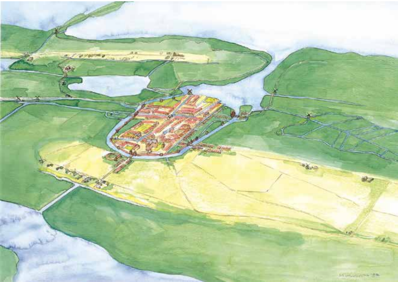
Alkmaar rond 1560. M. Valkhoff, naar ontwerp van Peter Bitter.

daan op de bewoners van het omringende platteland, voor zover die baat zouden hebben bij de fortificatie. 4 Bij de aanleg van de nieuwe vestingwerken koos men in principe voor aarden wallen rondom de stad, geheel of gedeeltelijk bekleed met metselwerk. Dit sloot aan op ideeën over moderne vestingbouw die begin zestiende eeuw in Italië waren ontwikkeld. Een belangrijk ander onderdeel van deze nieuwe ideeën, de aanleg van bastions, werd niet nagevolgd. Het stadsbestuur volstond met de bouw van elf ronde of halfronde torens die op regelmatige afstanden in de wallen en muren werden aangebracht. De werkzaamheden begonnen in 1527. 5 Op 24 april 1528 werd de eerste steen gelegd voor de bouw van de nieuwe Friesepoort. 6 Aan de noordoostkant van de stad werd in hetzelfde jaar een nieuwe vestinggracht gegraven, die het noodzakelijk maakte om een gedeelte van de Westfriesse Omringdijk te verleggen. Financiële problemen vertraagden de verdere aanleg. Pas in 1536 kwamen de vestingwerken tussen het Nieuwland en de Kennemerpoort gereed. Een flink gebied werd hier bij de stad getrokken, omsloten door een nieuw gegraven vestinggracht, de latere Oudegracht.