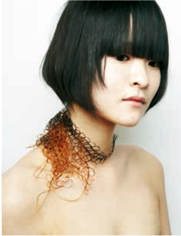
2 Maho Takahashi, Gradation , 2012, menselijk haar.

schoonheid van dit materiaal, zoals ook de Mourn to celebrate collectie verraad. Takahashi vergeet ook de details niet door bijvoorbeeld extra aandacht op een enkele haar vestigen: deze isoleert ze om deze vervolgens in kunsthars te vatten. De broches krijgen titels mee als Split end , Single knot en Single loop , duidend op gespleten haren en haren die in de knop zijn geraakt; kleinigheden die iedereen wel herkent zonder er lang bij stil te staan. 9 Zoals gezegd verwerkt Takahashi voornamelijk haar eigen lokken.