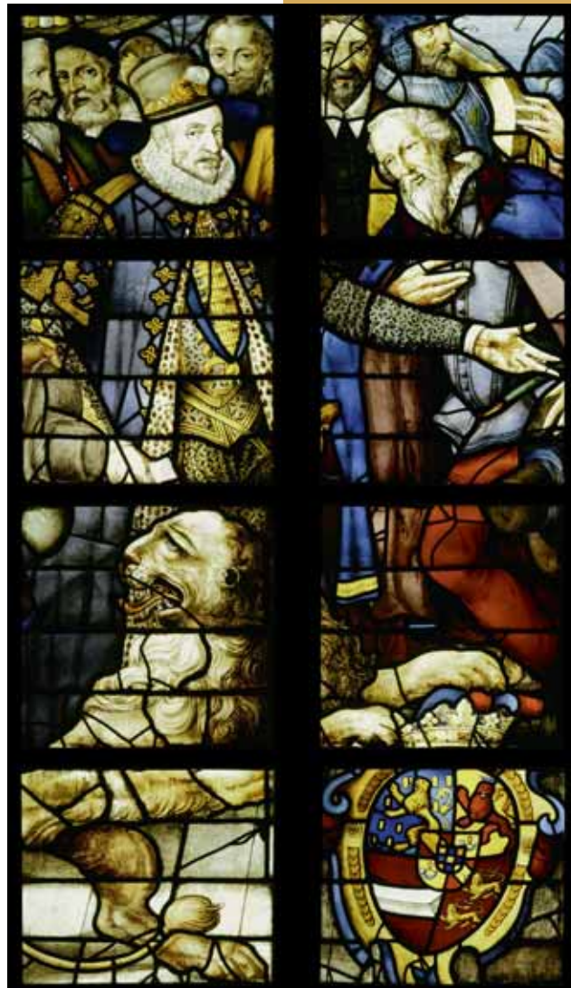
▲ Prins Willem van Oranje. Detail uit Het ontzet van Leiden, door Isaac Claesz. van Swanenburg, 1600-1604, Sint-Janskerk Gouda.

Maurits werd in 1585 stadhouder van Holland en Zeeland, en in 1590-1591 ook van Utrecht, Gelderland en Overijssel. Terzelfder tijd was zijn neef Willem