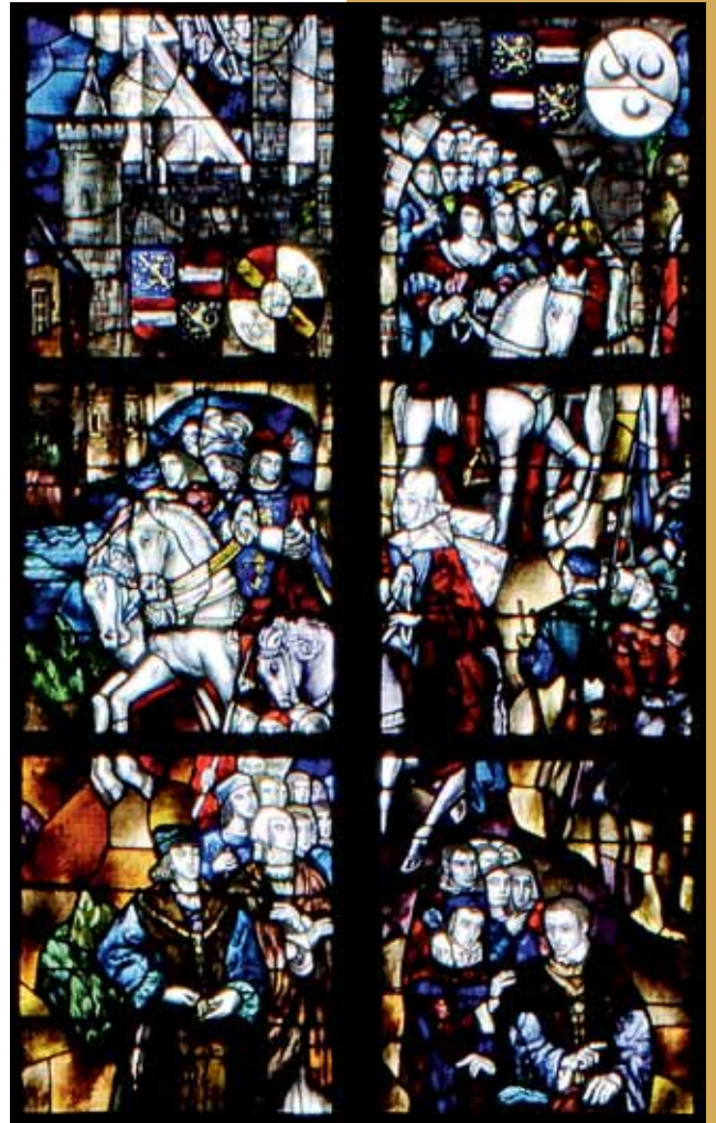
▲ Ruitersstoet met in het midden te paard graaf Hendrik III van Nassau, zijn tweede vrouw Claudia van Chalon en links hun zoon René, achteraan graaf Engelbrecht I en Johanna van Polanen, die net de poort verlaten hebben. Detail uit Het raam der Baronie van Breda, door Willem van Konijnenburg en Joep Nicolas, 1933, Nieuwe Kerk Delft.

Dit alles gold ook voor de Nassaus, wier heerlijkheid Breda op een onduidelijk moment tot baronie werd verheven. Zij gingen zich steeds meer in de directe omgeving van de vorsten bewegen, vooral vanuit hun paleis in Brussel. Het meest zichtbaar was de stijging bij Hendrik III (1483-1538), achterkleinzoon van Engelbrecht I. Deze bekleedde niet alleen alle al genoemde functies in dienst van Habsburg, maar trok als voornaam raadsheer met Karel V en al eerder met diens vader Filips de Schone mee op hun dynastieke en politieke reizen, onder meer naar Spanje, en deed zich gelden als mecenas, onder andere zijn eigen stad Breda verfraaiend met het noordelijkste renaissancepaleis in de Nederlanden – en de Grote Kerk met opmerkelijke grafmonumenten en een gebrandschilderd venster. Zijn drie huwelijken sloot hij dan ook op zeker even hoog adellijk niveau: in Savoye, in het Vrijgraafschap Bourgondië (Franche-Comté), in Spanje. Vooral het tweede huwelijk, met Claude de Chalon (1498-1521), bracht deze Nassau perspectief op erfgoederen ten oosten van Frankrijk, rijker dan die van hemzelf: het soevereine prinsdom Orange en omvangrijke bezittingen tot in Franche-Comté. Ten gevolge van onverwachte sterfgevallen vielen die bezittingen aan hun enige zoon René of Reinout (1519-1544) toe, die zich als erfgenaam van de moederlijke goederen sierde met de moedersnaam Chalon. 3