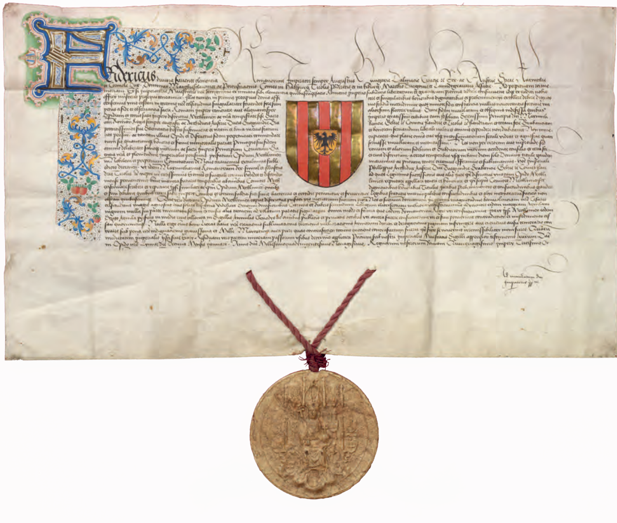
Afb. 1 'Wapendiploma van keizer Frederik III, met zegel, voor de stad Mechelen gegeven op 10 januari 1490. Vanaf dan voerde Mechelen de leus 'in trouwen vast' en het hartschild met de koninklijke adelaar. Mechelen, Stadsarchief, Inventarisnummer 60234 014.