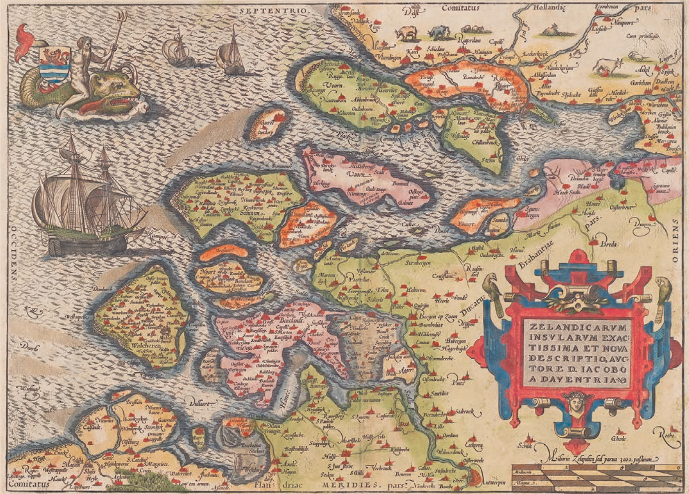
Afb. 1 Kaart van Zeeland, uitgegeven door Abraham Ortelius in 1570 naar de kaart van Jacob van Deventer uit 1545. Zeeuws Archief, ZI-I-0060.