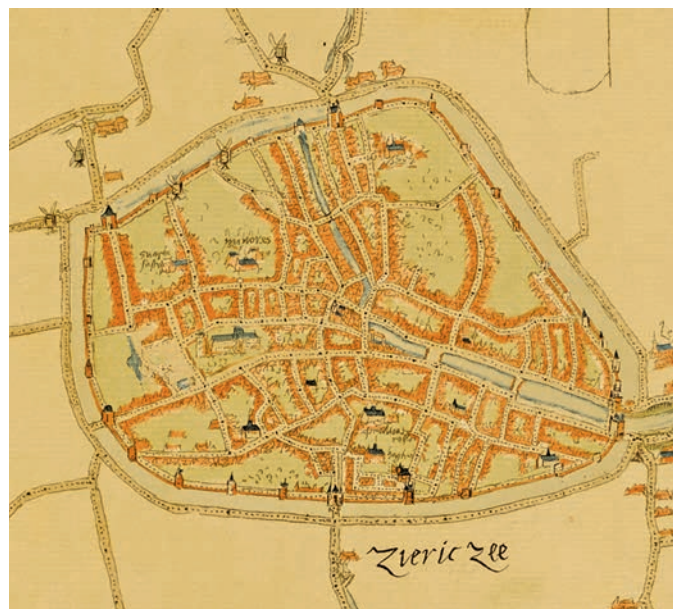
Afb. 2 Jacob van Deventer, plattegrond van Zierikzee, circa 1550. Zeeuws Archief, ZI-I-0533.

Naast besmettelijke ziekten eisten ook de elementen in de loop van de zestiende eeuw in deze stad hun tol. De weeskamerpapieren reppen van stormen waarbij ramen uit de sponningen vlogen en rieten omheiningen omwoeien, van branden waarbij huizen en zoutketen door het aanwakkeren van de wind in vlammen opgingen en van een schier eindeloze reeks van dijkdoorbraken, dijkvallen en inundaties. 15 Door de vele ‘grondeloze vallen ende afbreckselen’ veranderde Schouwen tussen 1500 en 1600 langzaam maar zeker van een ovaalvormig eiland in een halve maan. Zelden gingen de elementen echter zo tekeer als op Sint Felix Quade Saturdag (5 november 1530). Hoewel