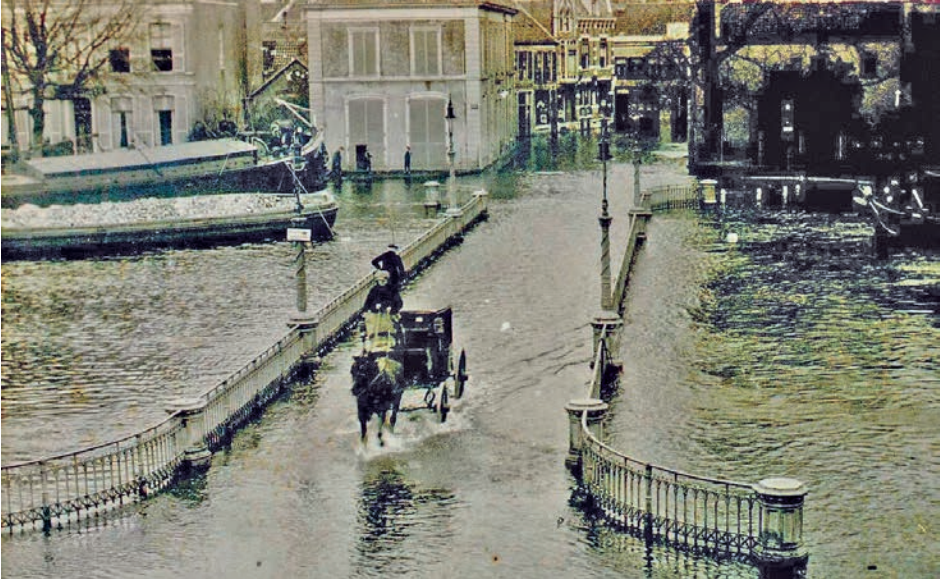
Afb. 4 Overstroming in Zwolle van de Potgietersingel en Eekwal in 1916 (collectie HCO).

van particuliere instanties. De overheid hield zich op de achtergrond. Terwijl het voor velen duidelijk was dat zonder overheidsgelden een dergelijk groot project niet te realiseren zou zijn. Het was dus zaak om het Rijk hiervoor te interesseren. Op initiatief van het Friese kamerlid Age Buma ontstond daarom in 1886 de Zuiderzeevereeniging. Buma had in de Tweede Kamer al eerder getracht de geesten voor afsluiting rijp te maken. Een in 1882 door hem ingediend voorstel werd vanwege het ontbreken van een financiële onderbouwing verworpen. 5 Nadat hij onvoldoende gehoor in de Tweede Kamer had gevonden, wilde hij medestanders buiten het parlement zoeken. In 1884 had hij contact gezocht met mr. P.J.G. van Diggelen. Op het station van Zwolle hadden beide mannen elkaar getroffen. Van Diggelen was naast rechter ook gemeenteraadslid van Zwolle en lid van de Provinciale Staten van Overijssel. Net als Buma was hij liberaal. Zijn vader was de al eerdergenoemde ir. B.P.G. van Diggelen. Affiniteit met het onderwerp kon hem dus niet ontzegd worden. Op 4 januari 1886 vond in Amsterdam de oprichting van de Zuiderzeevereeniging plaats. Volgens de in april aanvaarde statuten luidde haar doelstelling: ‘technisch en financieel onderzoek aan te leveren waardoor afsluiting en later drooglegging van de gehele Zuiderzee, de Wadden en de Lauwerszee wenselijk en uitvoerbaar is.’ 6