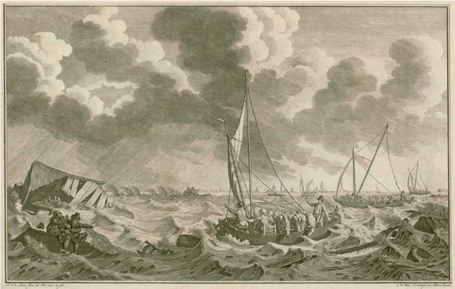
Afb. 1 Overstromingen nabij Kampen in 1775.

Op 21 maart 1918 werd door de Tweede Kamer zonder hoofdelijke stemming de Zuiderzeewet aangenomen. Nadat op 13 juni ook de Eerste Kamer had ingestemd kon een dag later de wet in het Staatsblad worden afgekondigd. Dit artikel gaat over de standpunten die in Overijssel in de voor afsluiting pleitende Zuiderzeevereeniging werden ingenomen en over de na de inpoldering gegroeide banden met het nieuw gewonnen gebied.