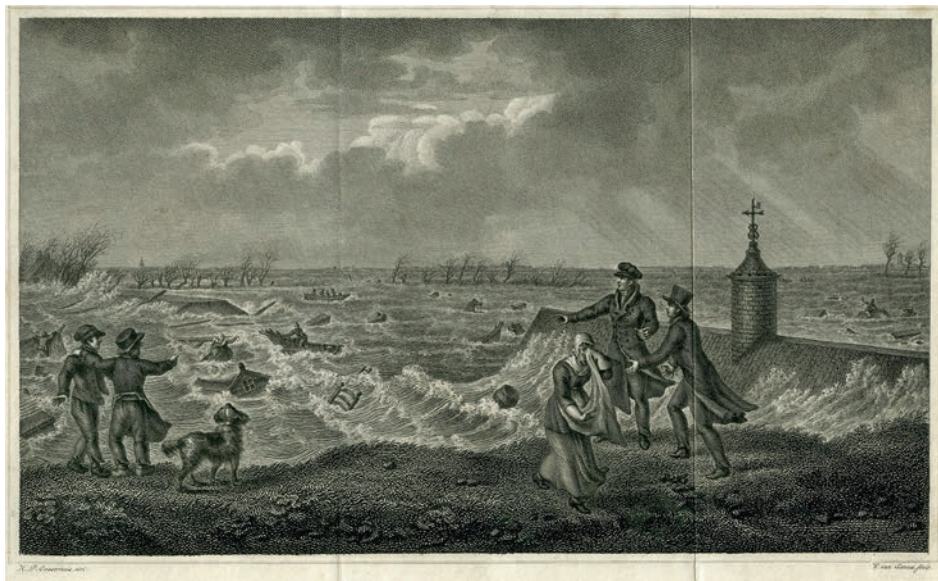
Afb. 3 Overstroming nabij Hasselt in 1825 (collectie HCO).

werden 2.284 gebouwen zodanig beschadigd dat ze onbewoonbaar waren geworden. Meer dan 13.000 runderen verdronken. 3 Na deze ramp is Overijssel bijna een eeuw lang voor grote overstromingen gespaard gebleven. Maar in 1916 was het weer raak. In deze contreien vielen geen doden, maar grote delen van Overijssel stonden wederom onder water. De overstroming van 1916 was echter de laatste grote watersnoodramp in het Zuiderzeegebied.