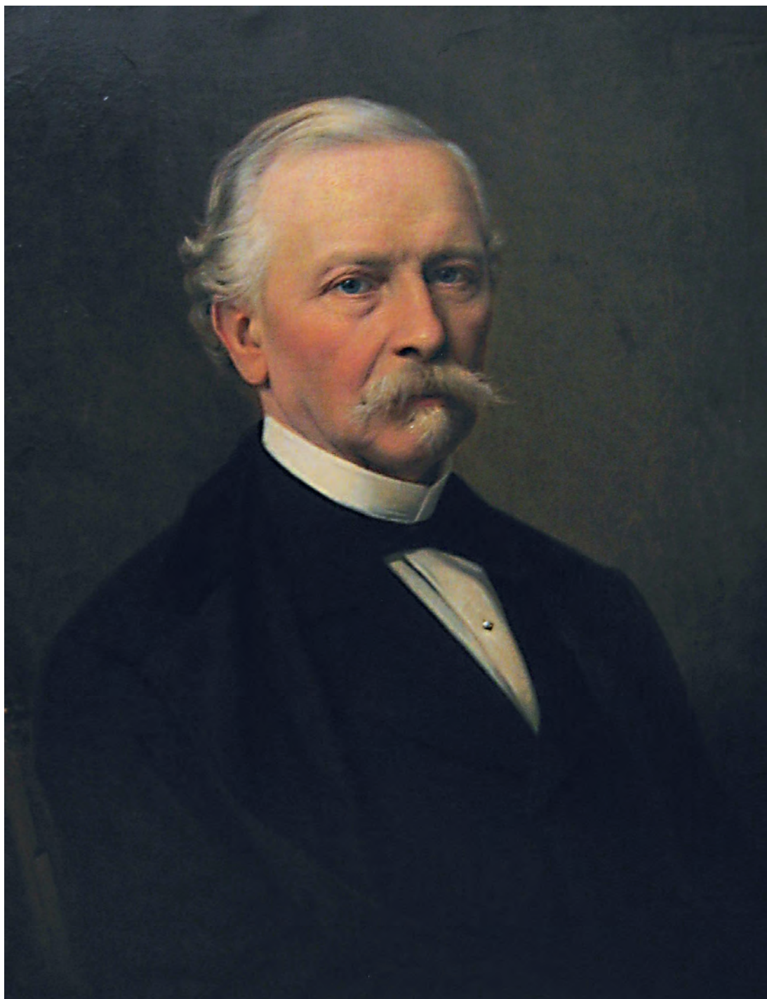
Karel E.M.H.A.F. Weber, 1889 (schilderij van Hein- rich Windhausen, olie op doek, 66,6 x 56,5 cm, collectie gemeente Roermond).