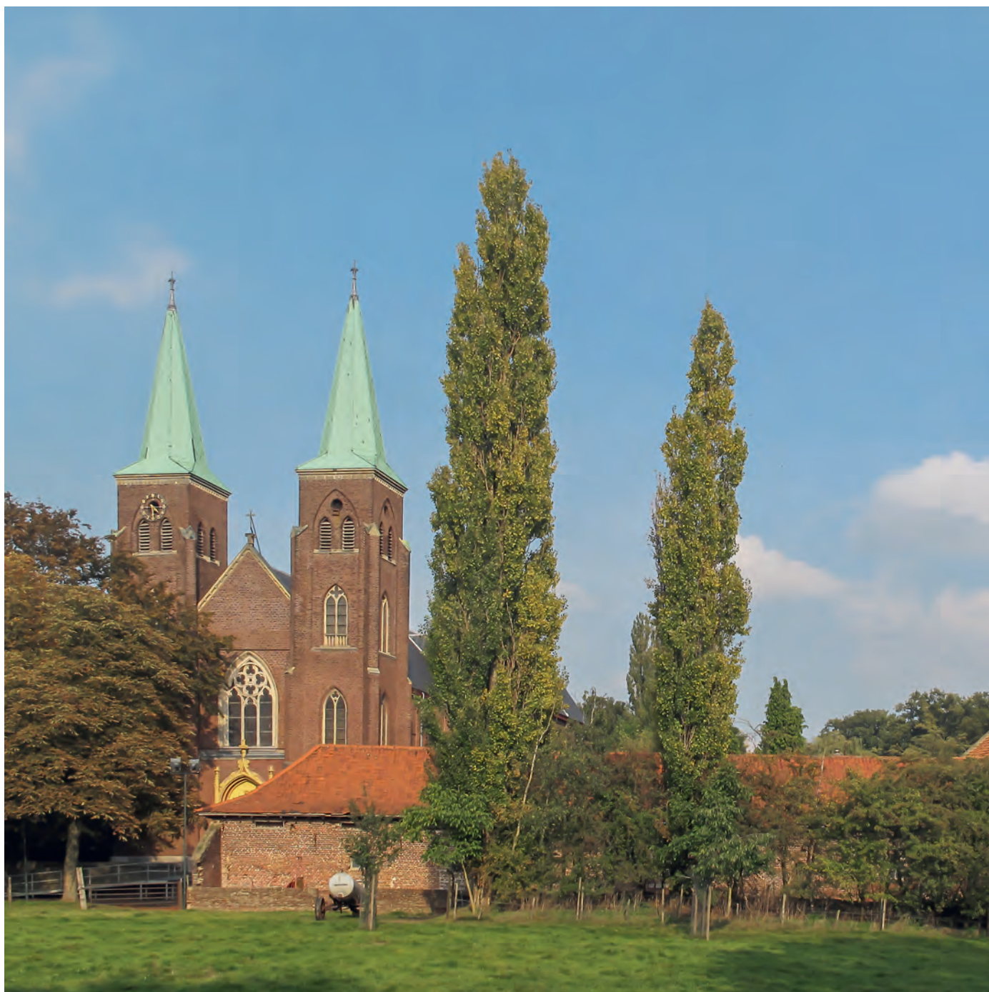
Kerk van Onze-Lieve-Vrouw-Onbevlekt-Ontvangen, Amstenrade (1852-1852).