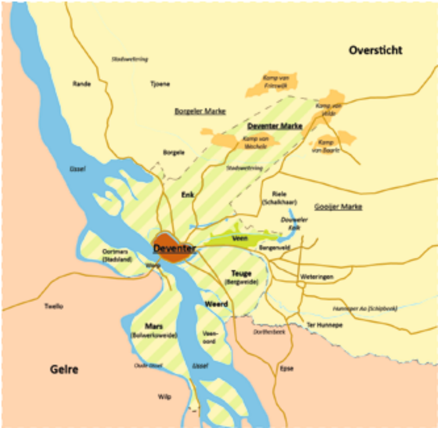
Kaart van het gebied van de Deventer stadsvrijheid (groen gestreept) zoals deze er waarschijnlijk uitzag in de late Middeleeuwen.

gespeculeerd, viel wel deels, maar niet geheel, samen met de stadsvrijheid. Over de marke zijn nauwelijks schriftelijke bronnen beschikbaar.