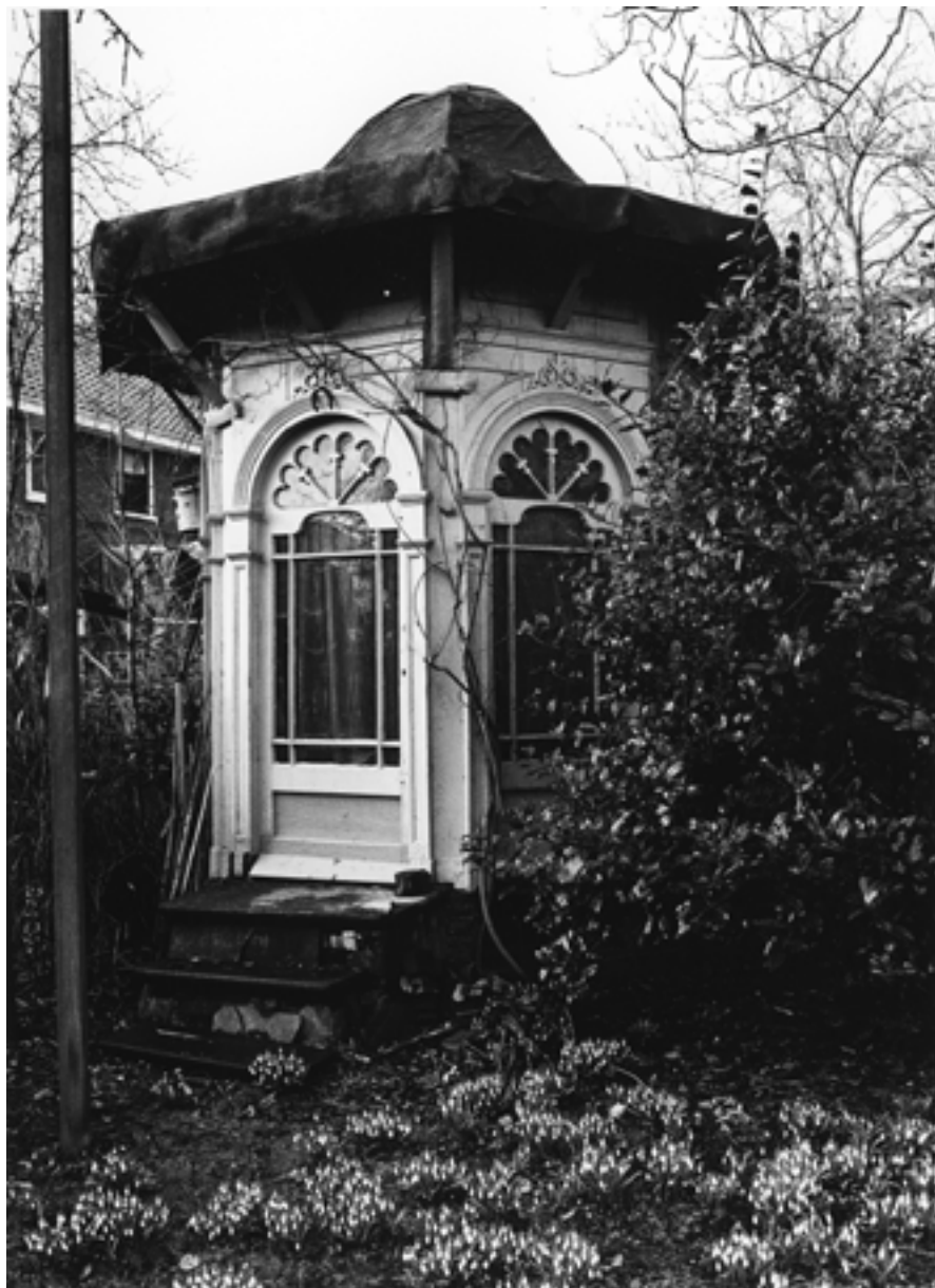
De enige theekoepe die in de Hoven bewaard is gebleven is uitgevoerd in pseudo Chinese stijl en staat in de tuin van een woning in de Langestraat.