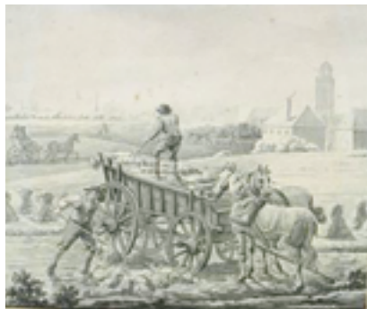
Boeren oogsten op de Deventer Enk, een koetsje rijdt op de Zwolseweg. Ongedateerde schildering door Nicolaas Sonnenberg.

ontstaan, met smalle, soms kronkelige stegen en straten die als de haarvaten van de stedelijke structuur uitkwamen op wijde pleinen. De Reductie leidde ook tot een radicale omkering van de richting waarin het achterland van Deventer zich uitstrekte: van het oosten en zuidoosten, tot ver in Westfalen en het Rijnland, naar het westen, met Holland. Die omkering zou moeizaam en traag verlopen en nooit ten volle haar beslag krijgen. Juist deze onregelmatige en niet rationeel gevormde plattegrond geeft Deventer haar eigen charme.