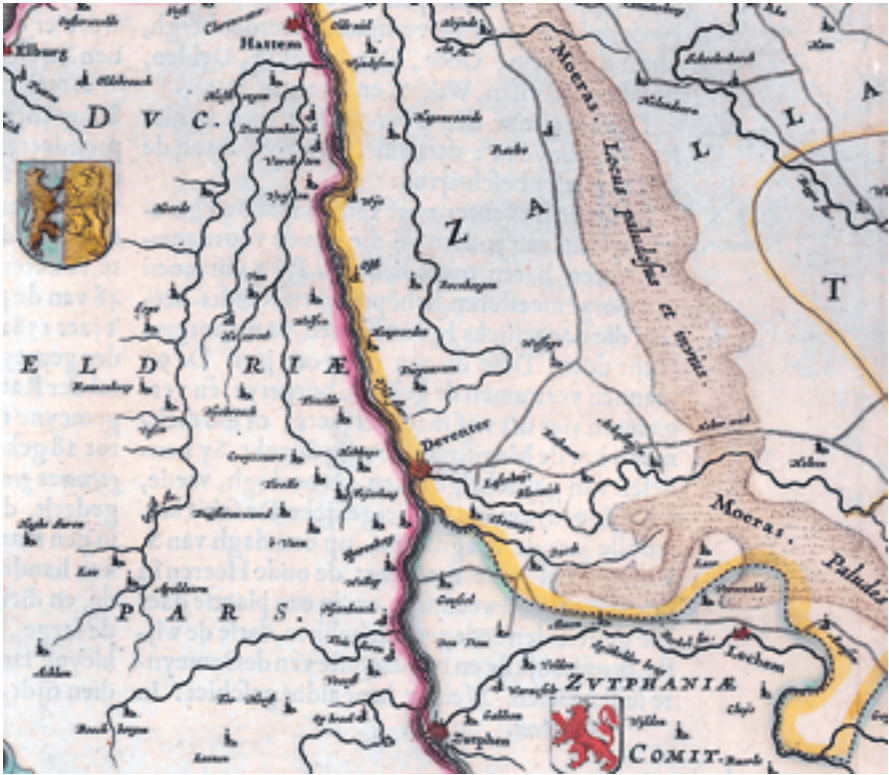
De regio Deventer op een uitsnede uit de kaart van Overijssel uit de Atlas Maior van Joan en Cornelis Blaeu uit 1638.

het noorden lagen stedelijke bezittingen in Heeten, Raalte en Noetsele, naar het oosten bij Rijssen, Enter en Markelo. In Gelderland lagen goederen onder Epse, Terwolde, Apeldoorn, Beekbergen en Lieren. In vrijwel al deze boerschappen hief de stad ook tienden. In ongeveer dezelfde regio lagen bezittingen van de gasthuizen, waarvan de bestuurders afkomstig waren uit de stadsregering. De zojuist gegeven opsomming geeft wel de grootste omvang van het stedelijk bezit aan, juist voordat een groot deel hiervan aan het begin van de 19 de eeuw te gelde zou worden gemaakt om de zware schuldenlast van de stad uit de Bataafs-Franse Tijd te helpen verminderen. 5