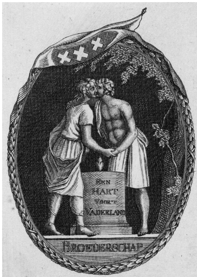
Afb. 2 Schild met Broederschap. Op de Vrijheidsboom te Amsterdam. Onbekend (1795). Prent 111 x 79 mm. Rijksmuseum Amsterdam (RP-P-OB-86.464).

belangrijke artikelen geschreven over vaderlandsliefde en vaderlandsgevoel. 28 Vaderlandsliefde wordt door hem gezien als kenmerkend voor de eigenheid van de Nederlandse patriottentijd. In de patriottentijd was vaderlandsliefde tot een politiek wapen geworden dat een gevoel van nationale saamhorigheid creëerde 29 al heeft, volgens Van Sas, de term patriot een meer uitgesproken politieke connotatie dan de term vaderland. 30