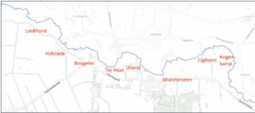
Afb. 3 | De locaties in het latere IJhorst die we in de rentmeestersrekening van 1499/1500 tegenkomen. Voor de meeste namen is gekozen voor de hedendaagse varianten. Voor 'Ywerstvene' en de 'Hoeffstede' zijn de namen vertaald. Er is gekozen voor Esphorst in plaats van Respers, omdat Esphorst in de context van dit artikel duidelijker is.

schoppelijke rentmeester van Salland een aanwijzing vinden over de eerste bewoning. 15 Op enkele pagina's in deze jaarrekening wordt een hele rits van goederen genoemd, waarover jaarlijks zogenaamde 'tynsen' aan de bisschop van Utrecht betaald moesten worden. 16 Dat ze aan de bisschop betaald moesten worden, gaf aan dat deze gebieden ooit bezit waren van de bisschop van Utrecht.