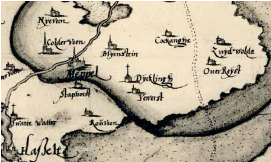
Afb. 2 | Detail van een kaart van Overijssel en Drenthe door Christiaan Sgrooten uit ca. 1575, waar Ijhorst aangeduid wordt met 'Ywerst'.

Dan het middeleeuwse lidwoord 'der'. De uitgang 'r' is bij dat lidwoord in het normale spraakgebruik verdwenen. Maar bij een aantal geografische namen in de buurt van Ijhorst is die in streektaal blijven bestaan als de eerste letter van de naam een klinker was. Dat is bij 'Der Iewerst' het geval geweest, maar ook bij 'Der Espers' (Esphorst) en 'Der Oaverst' (Havehorst of Havikshorst). Omdat de 'r' in het lidwoord geen betekenis meer had, is die voor het gevoel bij de naam zelf gaan horen: 'De Rieverst', 'De Respers' en 'De Roaverst'. 4 In de spreektaal hoor je ook weinig of geen verschil als je het hebt over 'Der Iewerst' of 'De Rieverst'.