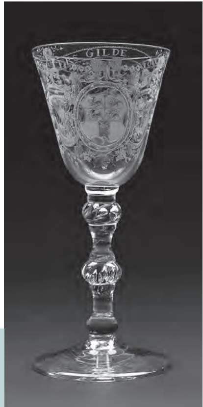
Afb. 1 Kelkglas gegraveerd met rosmolen, familiewapen, stadswapen en vermelding 'De goede harmonie in het grutters gilde'.