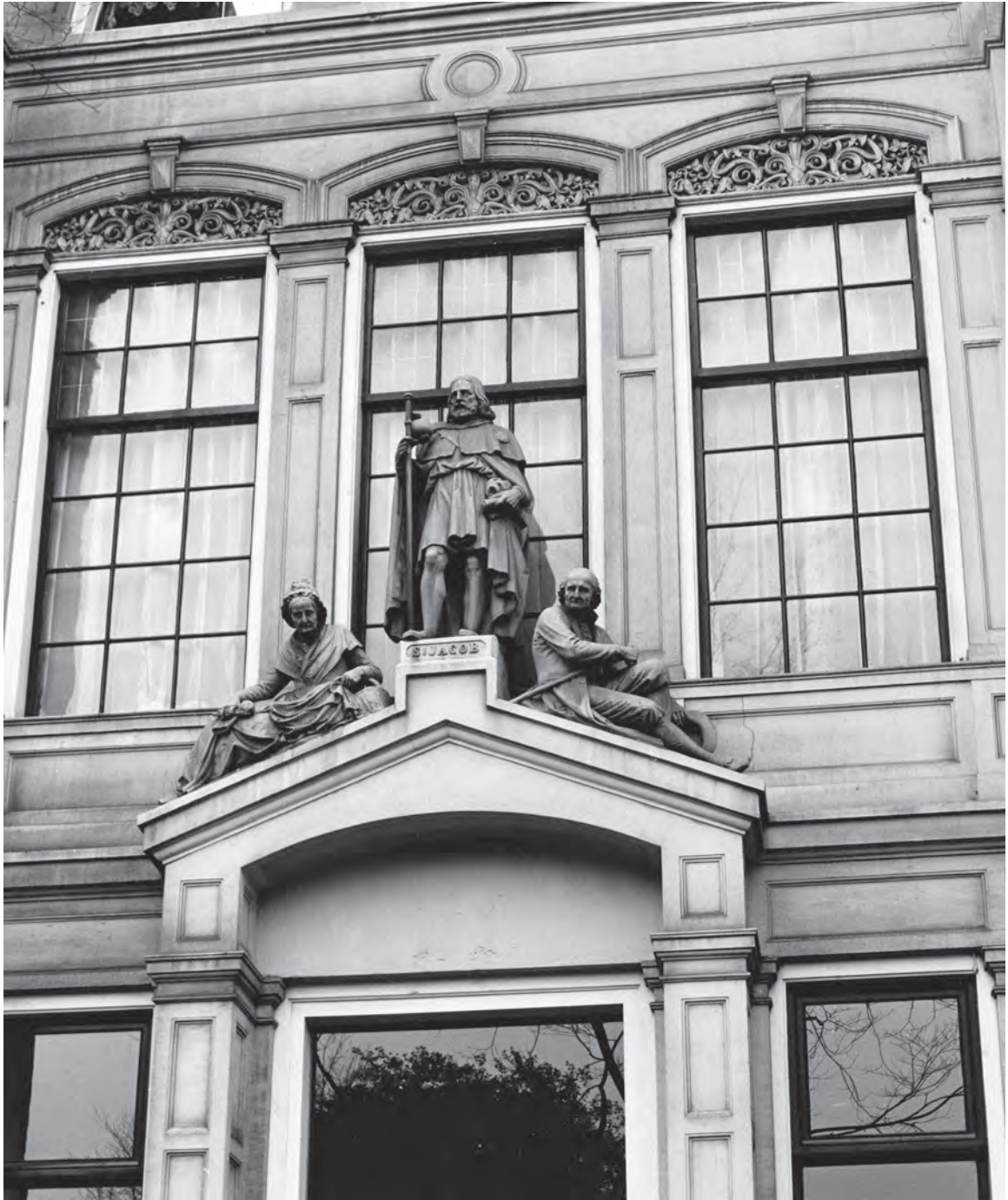
Het beeld van Sint Jacob door Louis Royer, 1866. De beelden van de oude man en vrouw ter weerszijden van de heilige zijn van Jean Stracké.