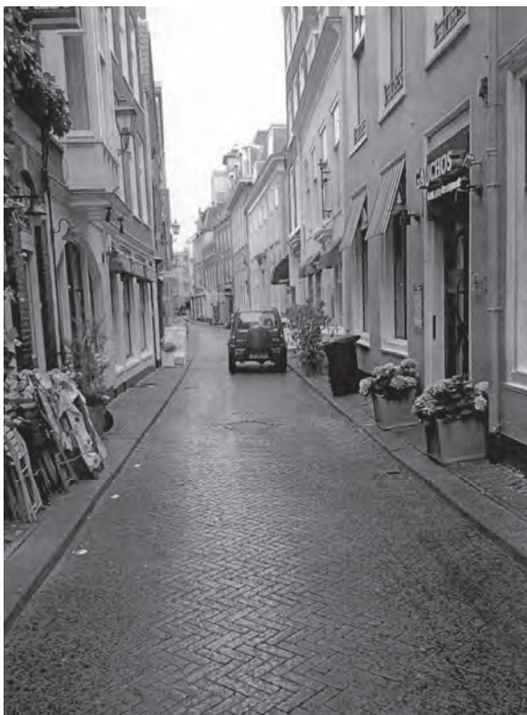
Afb. 2. De Oude Molstraat anno 2016.

Hoewel in de bibliotheek van de Vereeniging ter bevordering van de belangen des boekhandels enige bedrijfsdocumentatie van Vervloet aanwezig is, ontbreken daarin helaas de 'lijst van intekening' en de catalogus van zijn 'Nederduitsche bibliotheek'. 15 Handelsinstinct kan Vervloet niet ontzegd worden. In hetzelfde Dagblad van 's Gravenhage van 5 december 1827 adverteerde hij, inspelend op de actualiteit, met 'onderscheidene soorten van prentenboekjes en kinderspelen'. Ruim een jaar later liet Vervloet weer van zich horen. In het Dagblad van 's Gravenhage van 19 januari 1829 werd de volgende advertentie opgenomen: