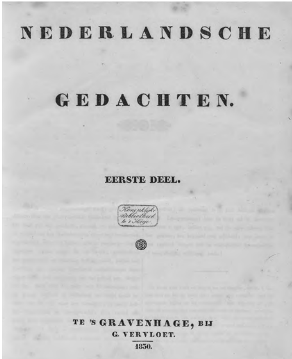
Afb. 3. Titelblad van de eerste, bij Vervloet verschenen uitgave van de Nederlandsche Gedachten van G. Groen van Prinsterer.

Deze reactie op het 'Ontwerp van wet' werd heel positief besproken in het tijdschrift De weegschaal (1829, p. 4). 16 Het is niet onwaarschijnlijk dat deze politiek getinte uitgave van Vervloet Groen van Prinsterer, een goede bekende van Schröter (1799-na 1845), op het idee bracht deze energieke jongeman te benaderen voor de uitgave van zijn Nederlandsche Gedachten . 17 A. van Rappard schreef op 1 oktober 1829 aan Groen van Prinsterer: