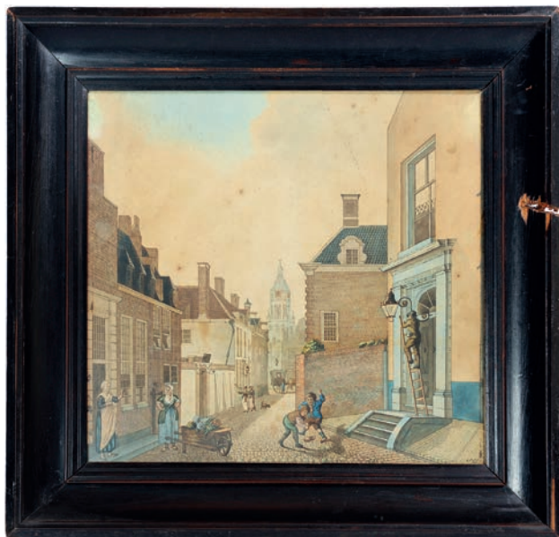
Afb. 2 Arnhem's stadsgezicht vanuit de Zwanensteeg met rechts een lantaarnopsteker en in de verte de toren van de Eusebius. Deze tekening laat zien hoe de stad eruit zag in de jaren dat Jacob Mattheus de Kempnaer zich in Arnhem vestigde en is mogelijk uit zijn bezit afkomstig. Inkt en aquarel op papier, gesigneerd r.o. 'C. Thoma 1810', 38 x 36 cm. De in 1944 door een granaatscherf veroorzaakte beschadiging aan de lijst getuigt van een latere episode uit de Arnhemse geschiedenis.