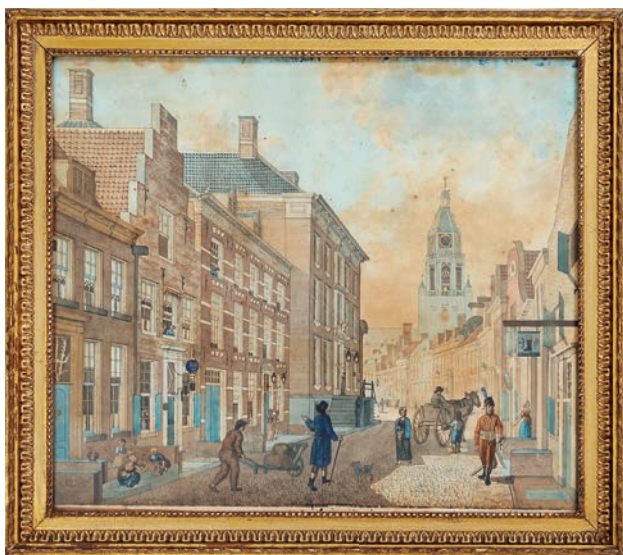
Afb. 3 Stadsgezicht in de Koningstraat, met op de achtergrond de toren van de Eusebius. Ook deze tekening is mogelijk uit het bezit van Jacob Mattheus de Kempnaer afkomstig. Inkt en aquarel op papier, 42 x 37 cm door C. Thoma (niet gesigneerd), circa 1810, de lijst dateert ook uit die tijd.

gemoderniseerde Gouvernementsgebouw op; kaatsbaan en hoofdwacht waren in 1819 afgebroken, waarna het gebouw kon worden vergroot en van een brede moderne gevel voorzien; de Markt won er, aldus Nijhoff, aanmerkelijk in ruimte en schoonheid door. 5 Het stadhuis aan de Markt had echter nog altijd een vervallen Gothische voorgevel. De Broerenkerk was in september 1805 vanwege bouwvalligheid al afgebroken; de Janskerk volgde in 1818. 6