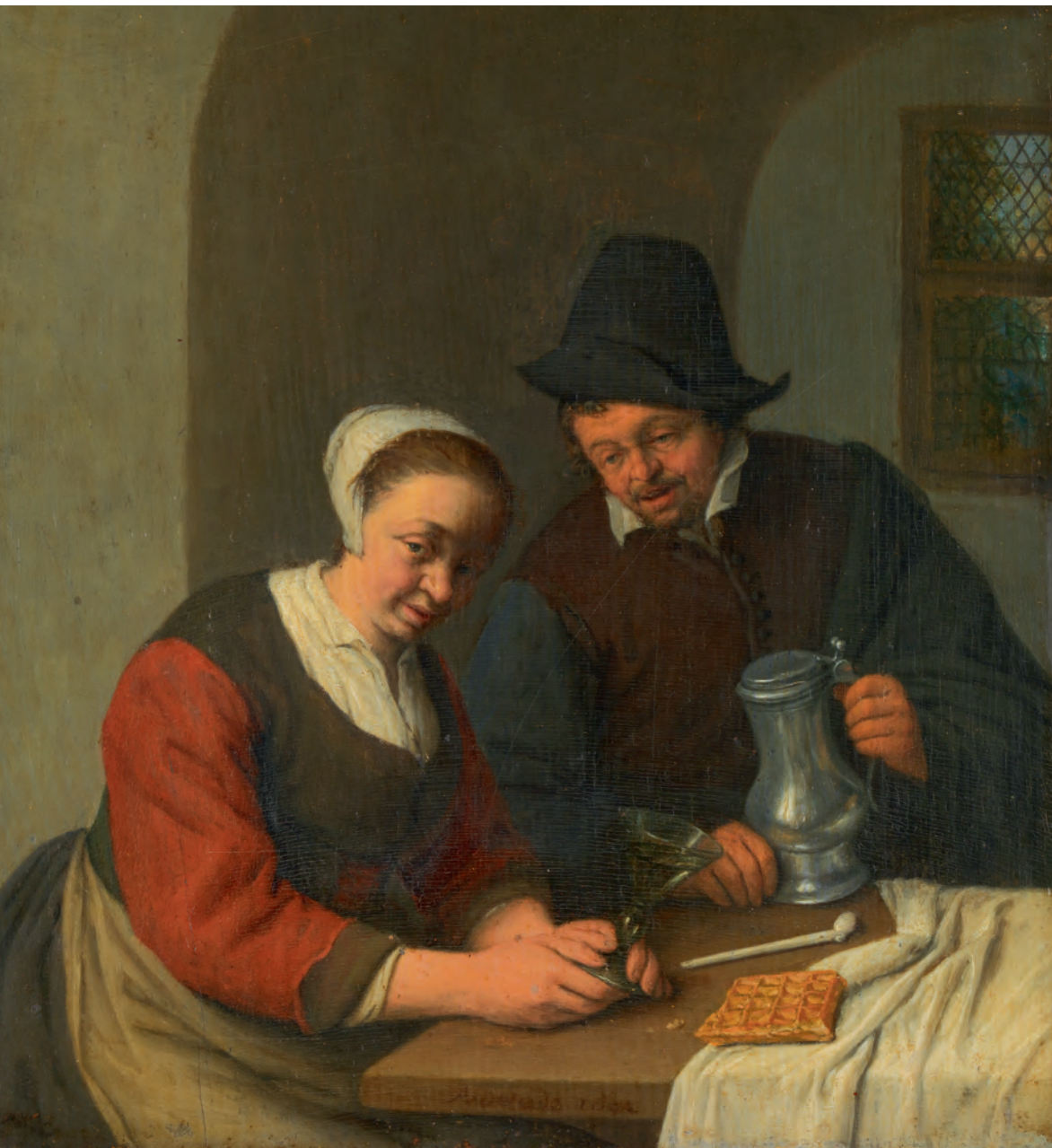
Adriaen van Ostade, Het vertrouwelijk onderhoud , 1672.