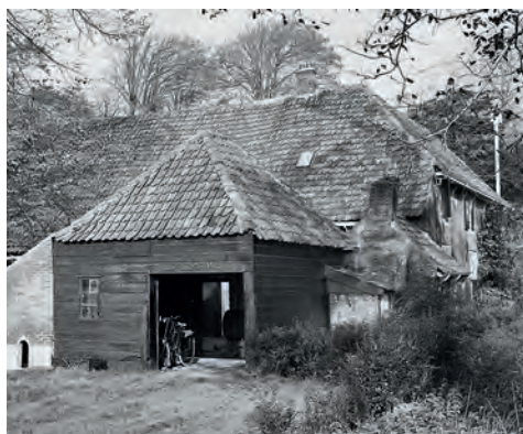
Afb. 4 De zuidzijde in oktober 1968 nog niet van de schuifdeur voorzien.