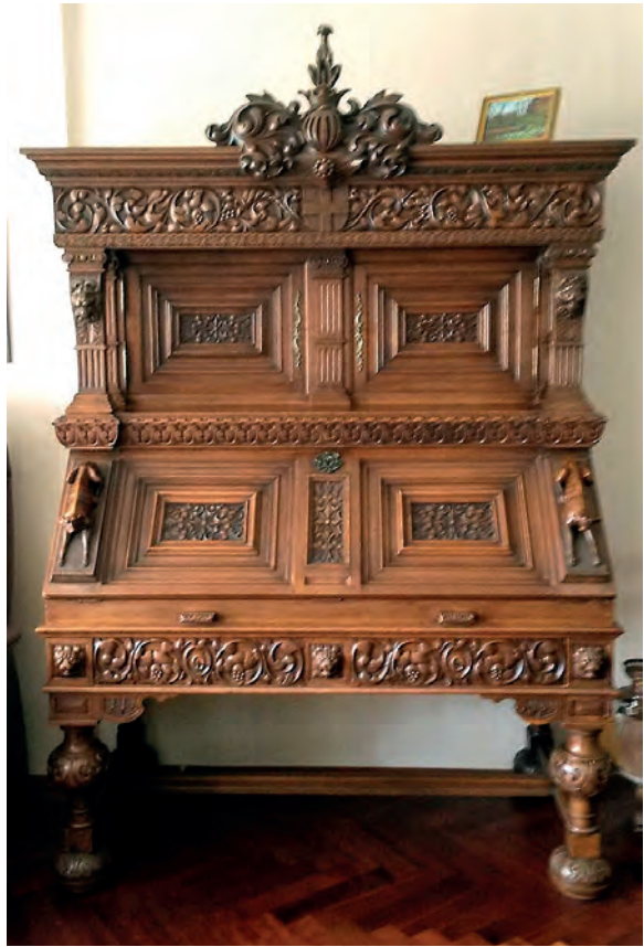
Afb.2 Het geschonken bureau met alle kenmerken van de adellijke familie Van Lynden.

taat is een verenigd Keukenhof, eigendom van Stichting Graaf Carel van Lynden, genoemd naar de laatste graaf. Deze stichting kreeg nieuwe bestuursleden en is in staat om de continuïteit van Keukenhof te waarborgen. Een landgoed van 238 hectare, met 15 rijksmonumenten, dat is opengesteld voor het publiek.