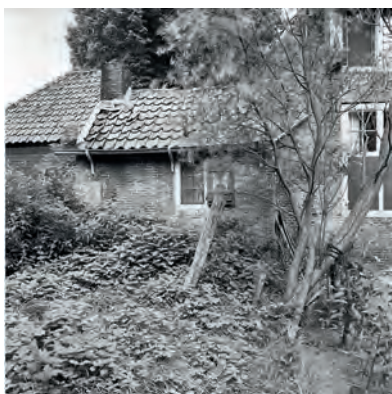
Afb. 5 De oostzijde van het bakhuisje in augustus 1977. Rijksdienst voor het Cultureel Erfgoed, inv.nr. 188.552.

bouw of aankapping van het karnhuis werd tijdens deze verbouwing eveneens de huidige waterpomp met een gemetselde onderbouw ingebracht.