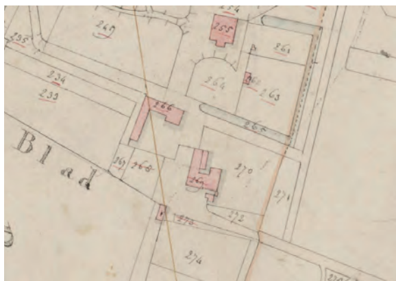
Afb.3 Detail van de kadastrale kaart uit 1832 met het bakhuis en de karmolen.

of bakhuis genoemd, alwaar enkele functies, zoals het spoelen van melkbussen, ondergebracht werden. Mogelijk werd in deze tijd in het bakhuisje het waterfornuis ingebouwd.