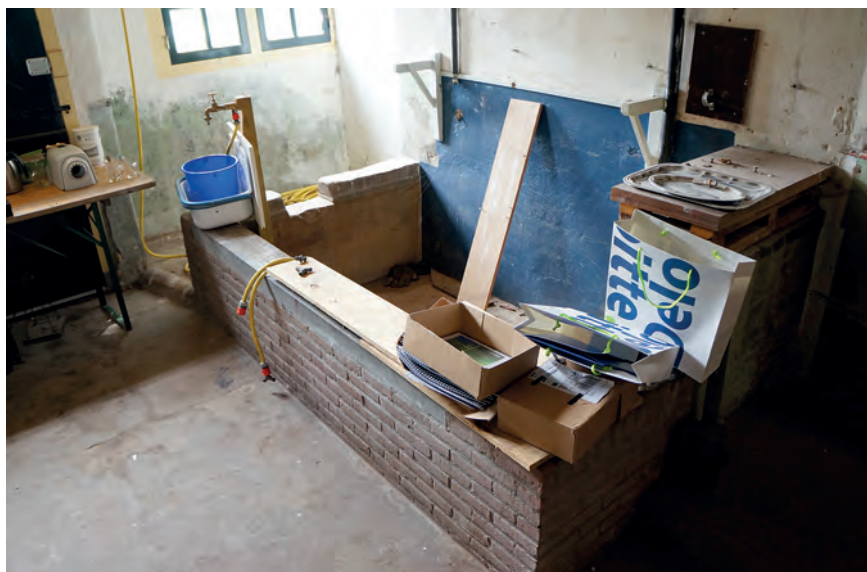
Afb. 2 Werkkeuken van de boerderij met de koelbak in 2013.

aanvankelijk zonder bakoven gebouwd, aangezien de bakoven niet in verband met het huisje werd gemetseld en slechts door middel van een inkassing aan de kopgevel gekoppeld was. Omdat het steenformaat van de oven identiek is aan dat van het karnhuis en bakhuisje is het aannemelijk dat alle bouwdelen relatief kort na elkaar gerealiseerd werden. Op de draagbalk van de rookvang van de schouw in het bakhuisje zijn diverse inscripties aanwezig, waaronder de getallen 1767 en 181 J, waaruit mogelijk afgeleid mag worden dat het bakhuisje in of vóór 1767 tot stand kan zijn gekomen. Overigens zijn er sporen van een lagere daklijn van het bakhuisje, zodat het mogelijk is dat er al een ander bouwwerk tussen de karmolen en het woonhuisgedeelte van de boerderij stond, vóór de bouw van het huidige bakhuisje.