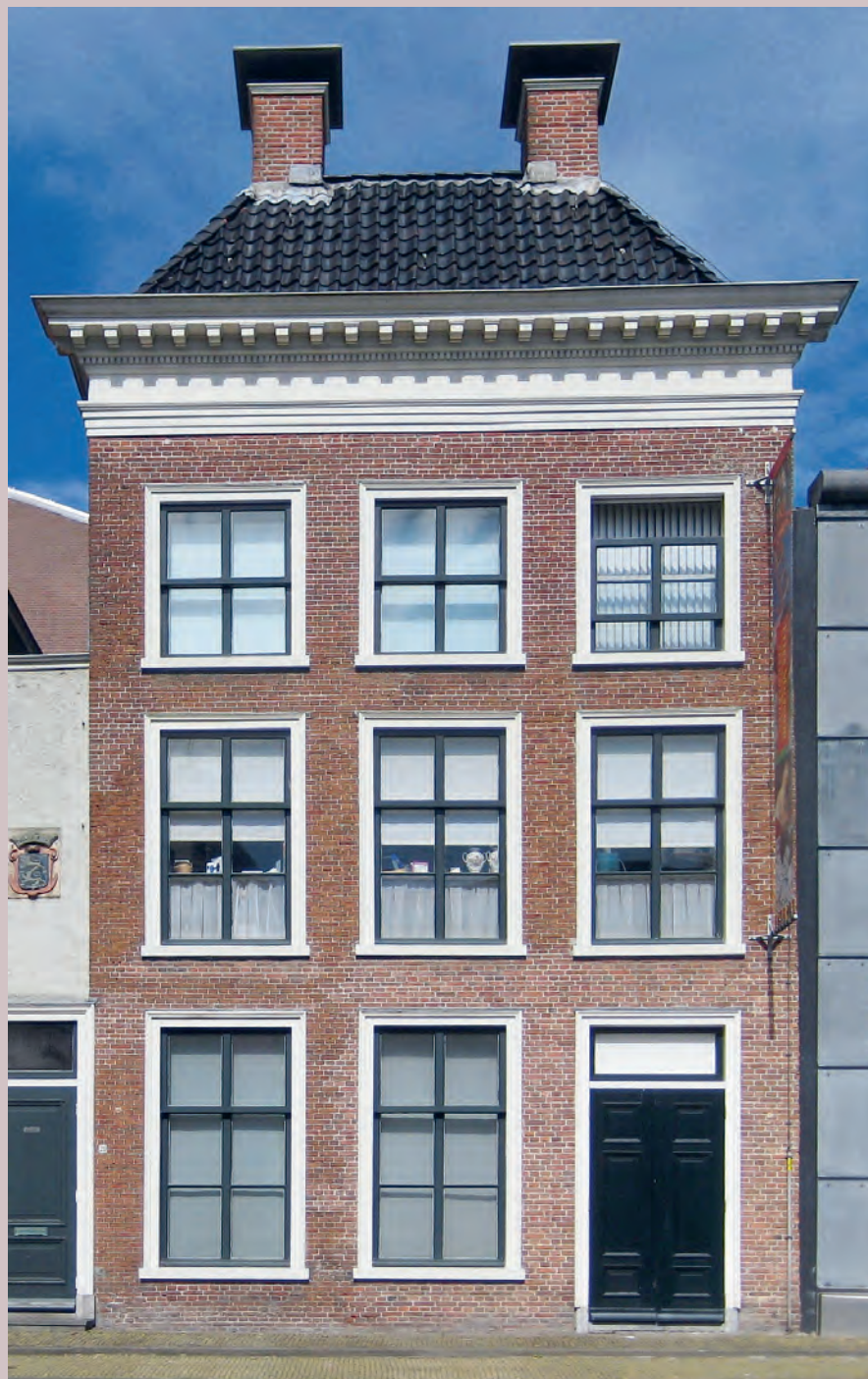
Het oudst bekende, door Gerrit van der Wielen gebouwde huis. Turfmarkt 18 in 2010.