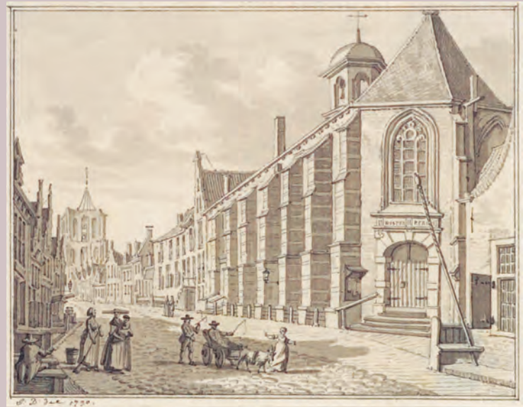
De Bagijnestraat met de Westerkerk in 1790. Tekening J. Bulthuis (HCL).