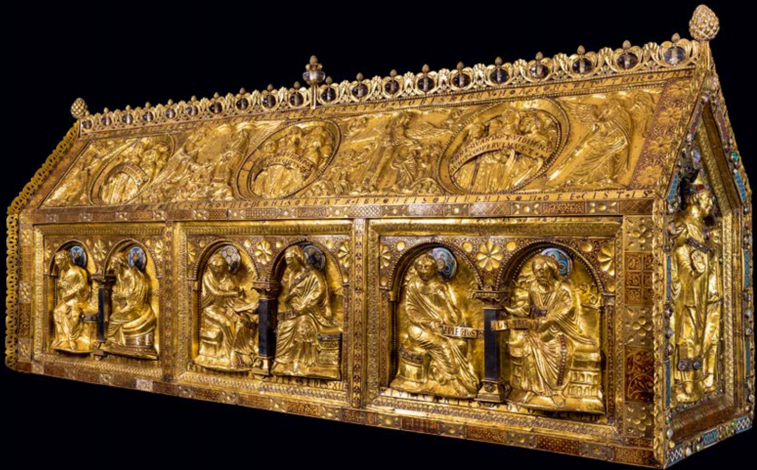
Afb. 3 | Noodkist (Servatiusschrijn), Schatkamer Sint Servaas, Maastricht.