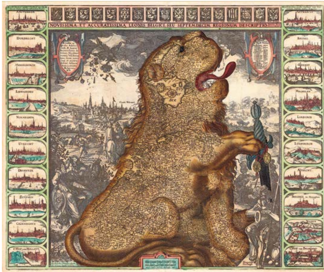
Afb. 1 | Leo Belgicus (de Nederlandse Leeuw) is een cartografische conventie waarbij de Nederlanden in de vorm van een leeuw werden afgebeeld. Claes Jansz. Visscher, Leo Belgicus, 1609.

wisten dat er geen goede oplossing bestond en we de knoop moesten doorhakken. Daarom is er geen hoofdstuk over de zogenaamde Vlaamse Primitieven en de Hollandse Meesters maar proberen we met illustrerende kunstwerken diagonalen tussen onze zeven lijnen te trekken.