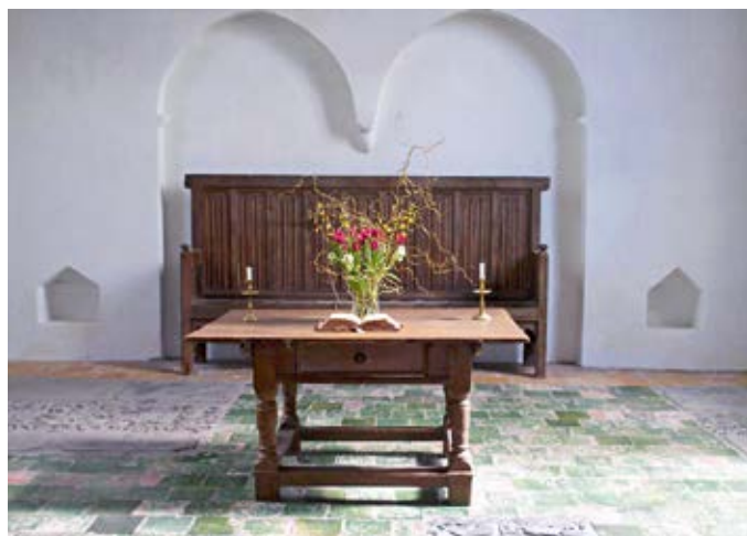
Afb. 1 | Interieur van de dertiende-eeuwse, romaanse Andreaskerk te Westeremden (Groningen), foto © M. van Stiphout, 2010.

De kerkvader Augustinus zei het al: ‘Wie God denkt te begrijpen, kent hem niet’. Schrijven over God is moeilijk. Het is dat altijd geweest en zal het altijd blijven want uiteindelijk gaat schrijven over God over geloof en/of ongeloof van de mens of over het onbegrip van de ene mens over het geloof of ongeloof van de andere mens. Schrijven over God in de Lage Landen is dan ook geen sinecure. En toch, sinds de komst van het christendom naar onze gewesten in de Romeinse tijd is het geloof in de christelijke God – in de persoon van Jezus Christus, want daarover gaat het in deze tekst bij uitsluiting – door de tijden heen een constante geweest. In deze bijdrage wil ik mij daarom richten op een beperkt aantal opvallende uitingen