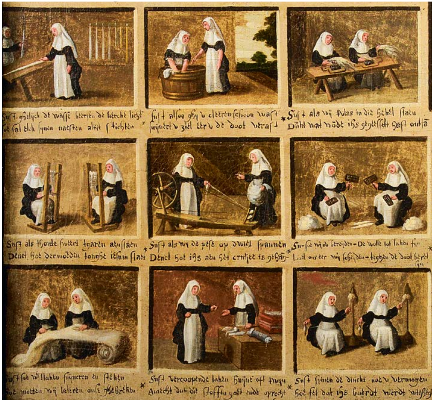
Afb. 4 | De werkzaamheden van de Mechelse begijnen, schilderij, zeventiende eeuw, anonieme maker, Museum Hof van Busleyden, Mechelen, foto Joris Luyten.