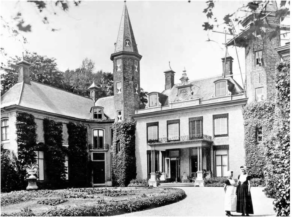
Ter Hooge, Koudekerke, vóór 1945. Op de begane grond links bevond zich de muziekkamer.