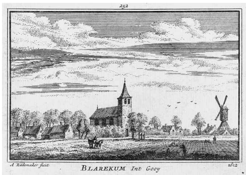
Afb. 1 Gezicht op Blaricum, door Abraham Rademaker (ca. 1727-1733).