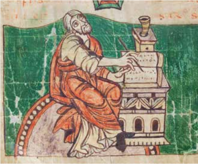
Afb. 3 Een schrijver in het Stuttgart Psalter. Württembergische Landesbibliothek Stuttgart, cod.bibl.fol. 23, f. 1v.

Om te beginnen is het belangrijk om te weten dat manuscripten, ook als ze niet vol versieringen en bladgoud zaten, buitengewoon kostbaar waren. Dat kwam om te beginnen door het feit dat er op perkament werd geschreven, duur materiaal dat door specialisten werd gemaakt van de huiden van met name geiten en schapen, maar in uitzonderlijke gevallen ook wel eens van duif of zeehond. Voor het maken van een codex van een pagina of honderd moest je dus om te beginnen de tot perkament bewerkte huiden van een kleine kudde hebben, en dan was er nog geen letter geschreven. Dat schrijven was weer het werk van andere specialisten, die gewapend met ganzenveer, inkt en een klein krabbertje om fouten te corrigeren de pagina's vulden. Wie een luxe boek bestelde moest ook aan dure verfstoffen zien te komen, plus een illustrator die goed kon tekenen. Het maken van mooi geschreven en rijk geïllustreerde manuscripten was daarmee tijdrovende klus waarin stevig geïnvesteerd moest worden. Het is daarom geen wonder dat het overgrote deel van de duizenden nog bestaande handschriften van voor het jaar 1000 alleen maar tekst bevat, en geen plaatjes.