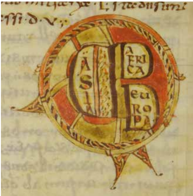
Afb. 1 Gestileerde wereldkaart met Azië links, Afrika rechts-boven en Europa rechtsonder. Karlsruhe, Badische Landesbibliothek, Aug.Perg. 229 f. 183v.

Waar de oplossing voor het dolende schaap voor ons nog wel herkenbaar is, wordt dat bij de aanpak van het slapeloze kind al een heel stuk lastiger. Voor het schaap dat niet in de kudde blijft wordt aangeraden om zout op de billen te smeren. Schapen likken immers graag aan zout, en als dit schaap dus een eigen afslag neemt, zullen er ongetwijfeld andere schapen achter haar aan lopen zodat ze niet in haar eentje verdwaalt. Een kind met nachtmerries moet echter behandeld worden met geitenhersens die door een gouden ring zijn gehaald: het kind eet daar een stukje van voordat het melk krijgt, en zal daarna vrij zijn van nachtmerries. Deze oplossing klinkt ons waarschijnlijk nogal bizar, onlogisch en ook enigszins smerig in de oren. Dat komt niet omdat vroegmiddeleeuwse ouders dom of vies waren, maar omdat ze een totaal ander referentiekader hadden dan wij. Zonder enige kennis van het be-