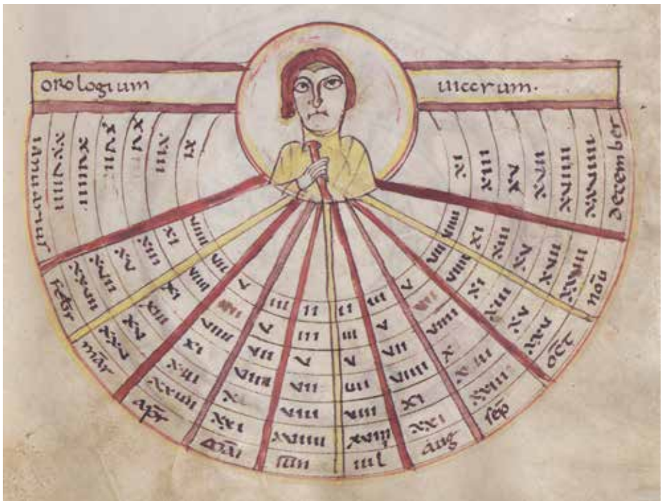
Afb. 5 Een zogenaamd horologium, waarmee je kunt vaststellen hoe laat het is op basis van de lengte van je schaduw [in voeten] per maand van het jaar. Een 'uitvinding' uit de Late Oudheid, die in de vroege middeleeuwen nog veelvuldig werd gebruikt. München, Bayerische Staatsbibliothek, clm 14456, f. 70r..

Een spreuk of gebed om je bijen te kalmeren, een middeltje tegen koorts, een manier om te ontdekken hoe laat het is op basis van de lengte van je schaduw (zie afbeelding 5), een snel recept om zelf shampoo of gezichtscrème te maken: dit waren allemaal zaken die zowel in intellectuele centra als op het platteland interessant en relevant werden gevonden. Bovendien: dit waren geen gescheiden werelden. Vanuit kloosters werd vaak de pastorale zorg over de kleine gemeenschappen in de omgeving uitgevoerd, en iedere iets grotere nederzetting had