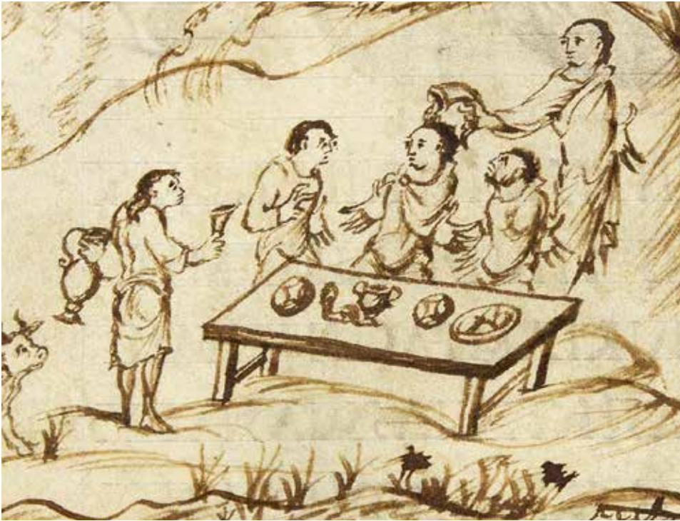
Afb. 2 Illustratie bij Psalm 103. Universiteitsbibliotheek Utrecht, Utrechts Psalter, f. 59v.

strijden van demonen (die naar de opvattingen van de tijd vaak verantwoordelijk waren voor nachtmerries) valt er, bijvoorbeeld, geen touw aan deze oplossing vast te knopen.